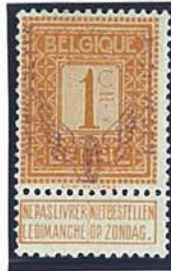
1 C "Cijfertekening"

Het is opmerkelijk dat de opdrukken op deze zegels zeer zwak zijn en weinig beïnkten zijn daardoor de veronderstelling dat de opdruk aangebracht werd als proef op niet uitgegeven zegels met het doel de intensiteit van de beïnkting uit te proberen.