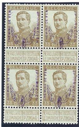
35 C kleine beeltenis, met naam tekenaar