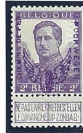
40 C 50 C 1 F 2 F grote beeltenis kleine beeltenis kleine beeltenis kleine beeltenis met naam tekenaar met naam tekenaar met naam tekenaar met naam tekenaar