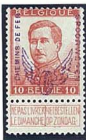
10 C grote beeltenis zonder naam tekenaar