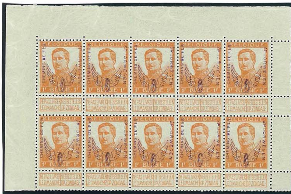
blok van tien van de 10 C - zegel op de ene zegel is de opdruk duidelijker dan op de andere