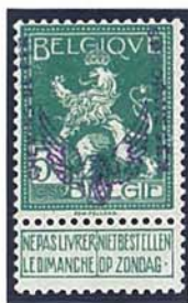
5 C staande leeuw

Om vervalsingen alsnog moeilijker te maken werd uiteindelijk besloten om geen zwarte inkt maar violette inkt te gebruiken. Opnieuw werd dit eerst uitgeprobeerd. De nog resterende postzegels met voorafgaande reliëfdruk werden voorzien van een violette opdruk.