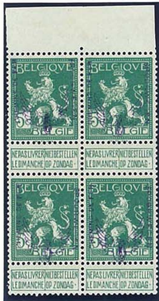
5 C staande leeuw