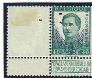
reliëfopdruk op bladrand zegel voorzien van reliëfopdruk en violette opdruk