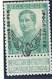
10 C – kleine beeltenis 40 C – kleine beeltenis proeven met opdruk aangebracht met normale stempel met zwarte inkt bovenop een opdruk van de droogstempel