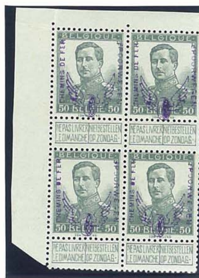
50 C kleine beeltenis, met naam tekenaar