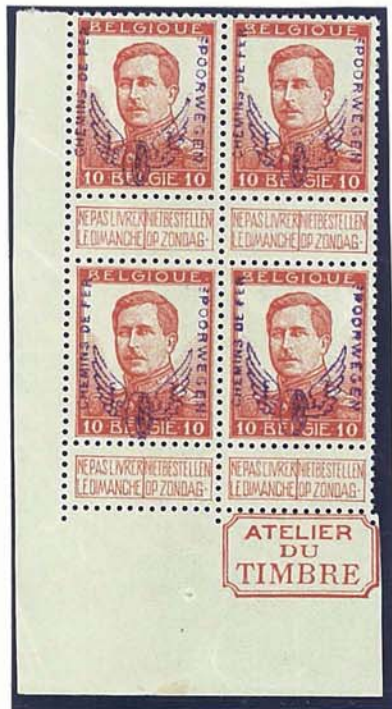
10 C - blok van vier met randinscriptie "ATELIER DU TIMBRE" de opdruk op de zegel rechtsonder is veel duidelijker

Eveneens door de kleurnuance van de zegel kan de opdruk beter of minder leesbaar zijn. Dit illustreren we hieronder met twee kleurnuances van de zegel van 25 C.