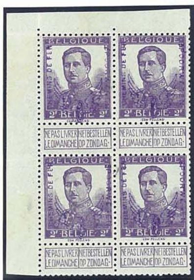
2 F kleine beeltenis, met naam tekenaar