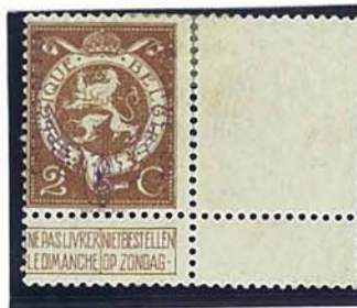
2 C "Staande Leeuw"