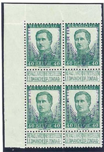
40 C grote beeltenis, met naam tekenaar