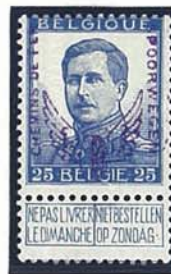
20 C 20 C 25 C grote beeltenis kleine beeltenis grote beeltenis zonder naam tekenaar met naam tekenaar zonder naam tekenaar