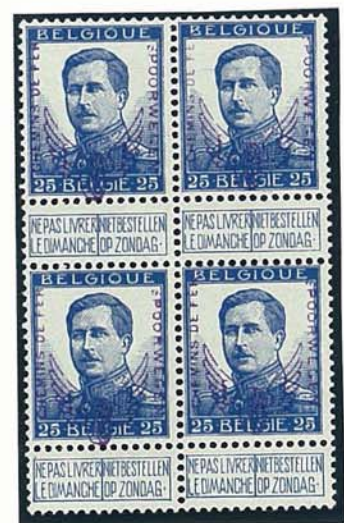
25 C in twee diverse blauwe nuances op de lichtblauwe losse zegel is de opdruk duidelijker dan op de blok van vier