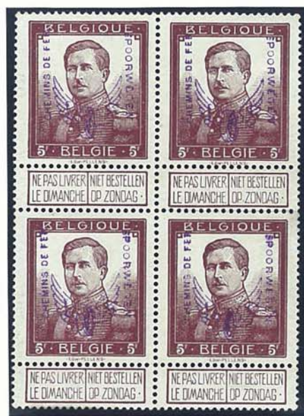
5 F groot formaat, met naam tekenaar tot op heden enig gekende blok van vier van de 5 F - zegel