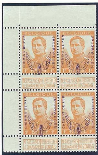
1 F kleine beeltenis, met naam tekenaar