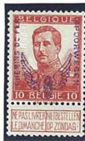
10 C kleine beeltenis met naam tekenaar