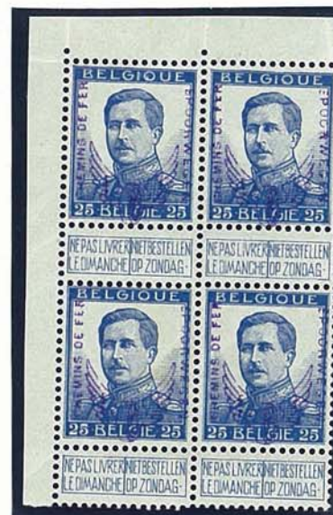
25 C grote beeltenis, zonder naam tekenaar