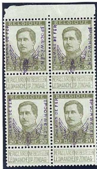
20 C grote beeltenis, zonder naam tekenaar