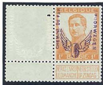
reliëfopdruk op bladrand zegel voorzien van violette opdruk zonder reliëfopdruk

Eveneens bestaan enkele exemplaren waarbij de bladboord van de zegel enkel met een reliëfopdruk is voorzien en de zegel zelf met of zonder de reliëfopdruk maar met een opdruk in violet (opdruk violet : zie verder).