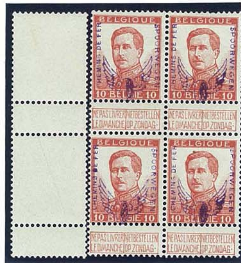
10 C grote beeltenis, zonder naam tekenaar