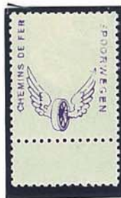
violette opdruk op velrand

Deze violette opdruk op een velrand illustreert de juiste beïnkting die op de definitieve zegels diende aangebracht te worden